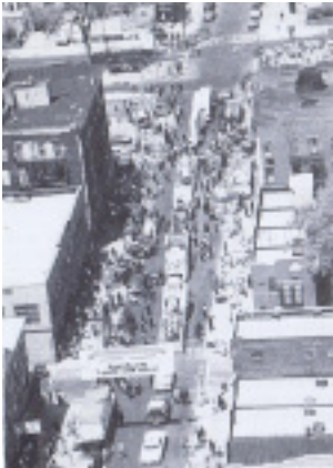
התהלוכה יוצאת מ-770