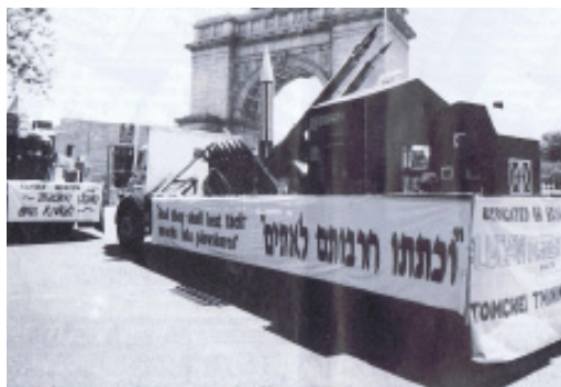
המוזגים ב'גראנד ארמי פלאזא', י"ב הפסוקים ומאמרי חז"ל, והקהל הריע להם במחיאיות כפיים סוערות.