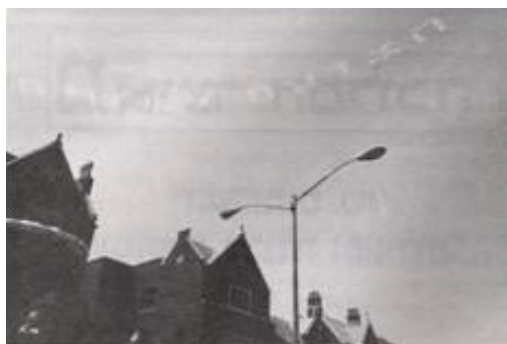
מטוסים יוצרים את המילים "הצדעה למשיח" בשמי ניו יורק