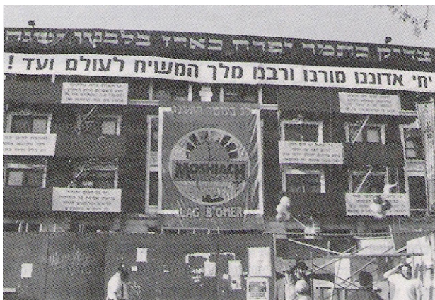
שלט 'יחי' על בניין המשרדים ליד 770